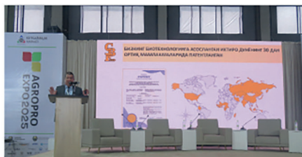
Фан янгиликлари тақдими