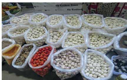
Маҳаллий қурт турлари